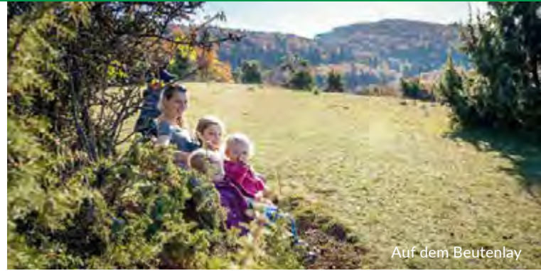
Auf dem Beutenlay