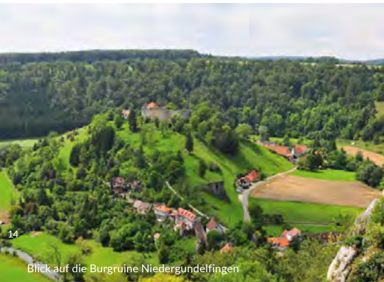
Blick auf die Burgruine Niedergundelfingen

Das Tal entlang der Lauter zählt zudem zu den burgenreichsten Tälern Südwestdeutschlands . Besonders hervorzuheben sind die Burgruine Bichishausen, die Burgruine Hohengundelfingen, die Burgruine Niedergundelfingen, die Burg Derneck, die Burgruine Wartstein sowie die Burgruine Hohenundersingen.