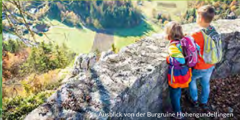
Ausblick von der Burgruine Hohengundelfingen